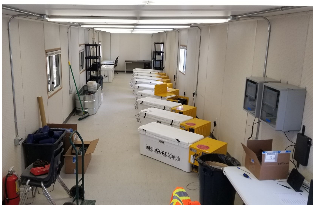
Vue du local où sont situés les systèmes C3 Match

À la suite du succès du programme de suivi géotechnique mis en place à la mine Jansen au Canada, GKM Consultants a été mandatée par TRL (Thyssen-Redpath-Ledcor) et BHP pour concevoir, déployer et mettre en route un système de contrôle du mûrissement du béton à grande échelle. Le défi que GKM Consultants a attaqué de front était que les éprouvettes de béton utilisées pour le contrôle qualité doivent être mûries à la surface à exactement la même température en temps réel que le béton utilisé 900 mètres sous terre. GKM Consultants a développé et introduit une solution novatrice qui permet à TRL d'aller de l'avant avec la construction des puits.