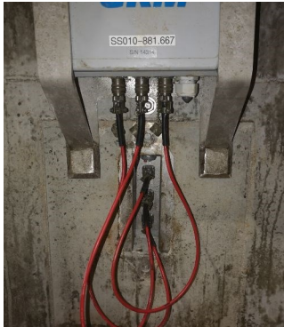
Noeud de la Série LS situé 900 m sous terre