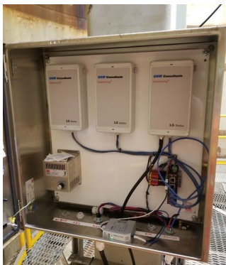
Boîtier LoRa qui collecte les données de chaque noeud